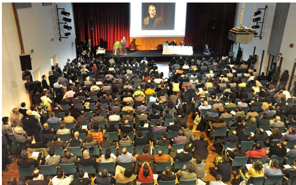
Uno dei nostri Seminari tenuti nella scorsa edizione di KlimaHouse (27 gennaio 2011)