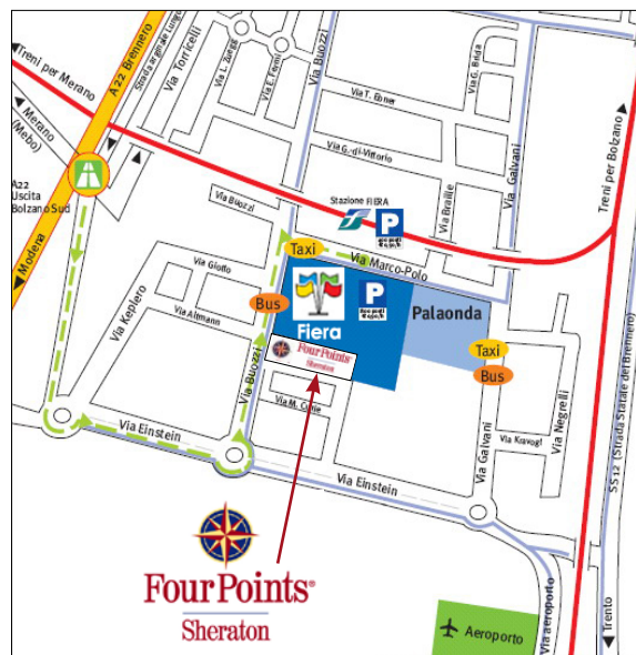
Uscita autostradale Bolzano Sud

Iscrizione gratuita ma obbligatoria tramite sito www.ilConvegno.eu/bolzano2012